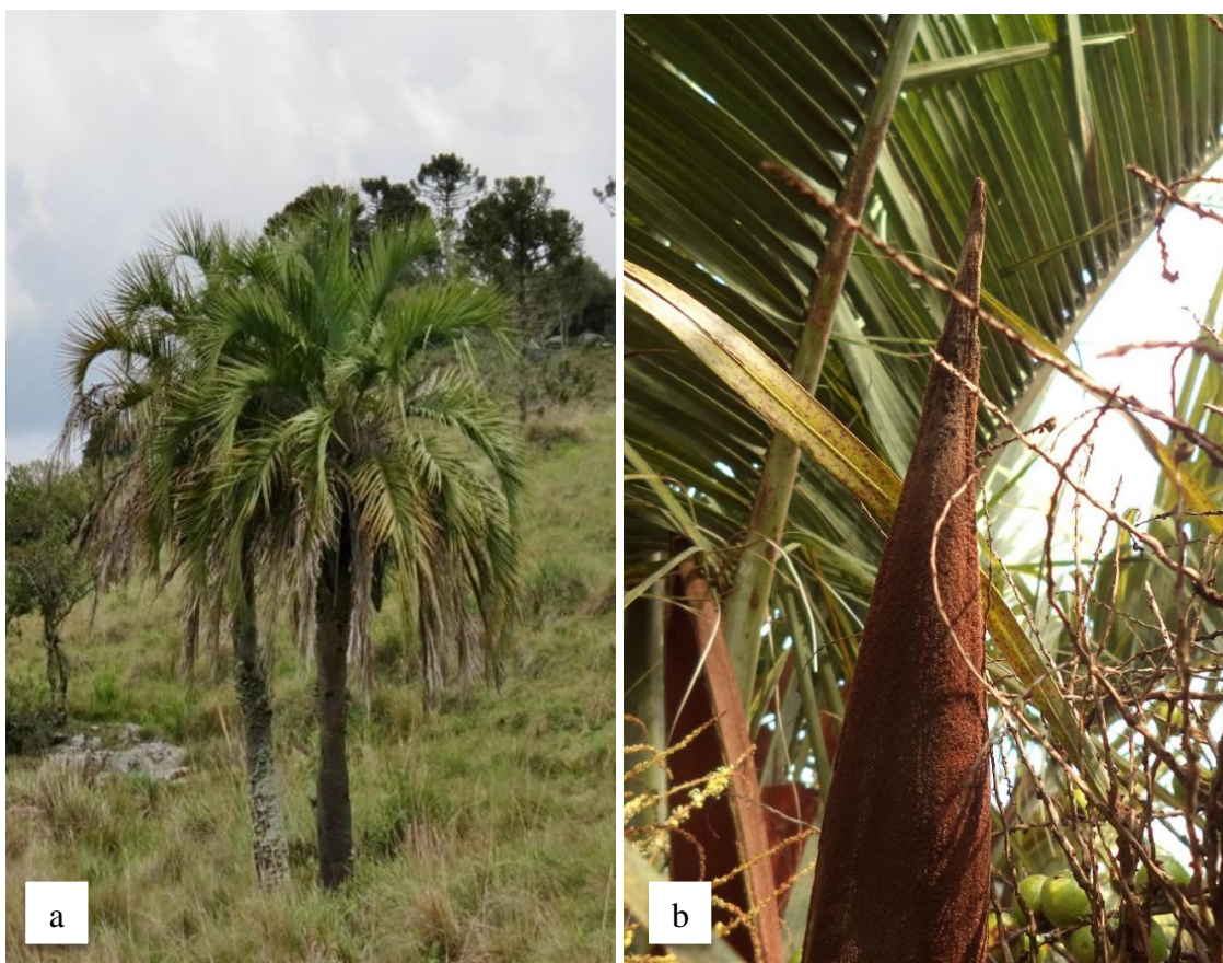
Figura 1. Butia eriospatha (Mart. Ex Drude) Becc. (a) hábito; (b) detalhe do indumento lanuginoso da bráctea peduncular.

Os espécimes de B. eriospatha podem ser facilmente identificados pela presença da bráctea peduncular que se apresenta revestida por um indumento de cor castanho-avermelhado de aspecto lanuginoso (Figura 1b), sendo este o carácter distintivo da espécie (Noblick, 2014). Essa característica também está presente em B. microspadix Burret (as espécies diferem em tamanhos do caule), mas ausente no restante do gênero. Os frutos são globosos, com mesocarpo carnoso e pouco fibroso, com endocarpo arredondado possuindo 1-3 sementes (Noblick, 2010).