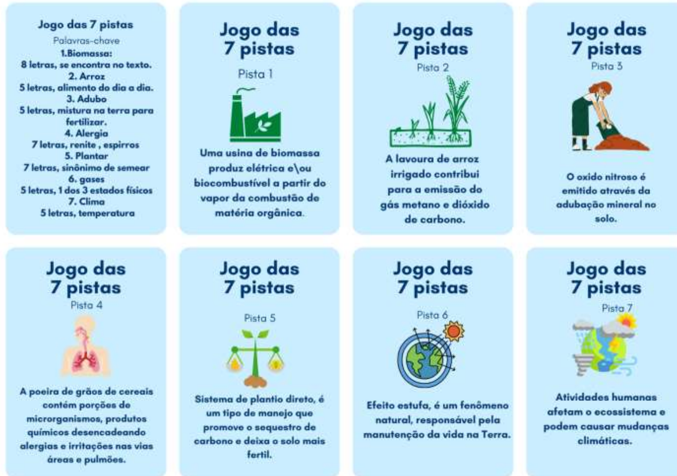
Figura 3- Jogo das 7 pistas.