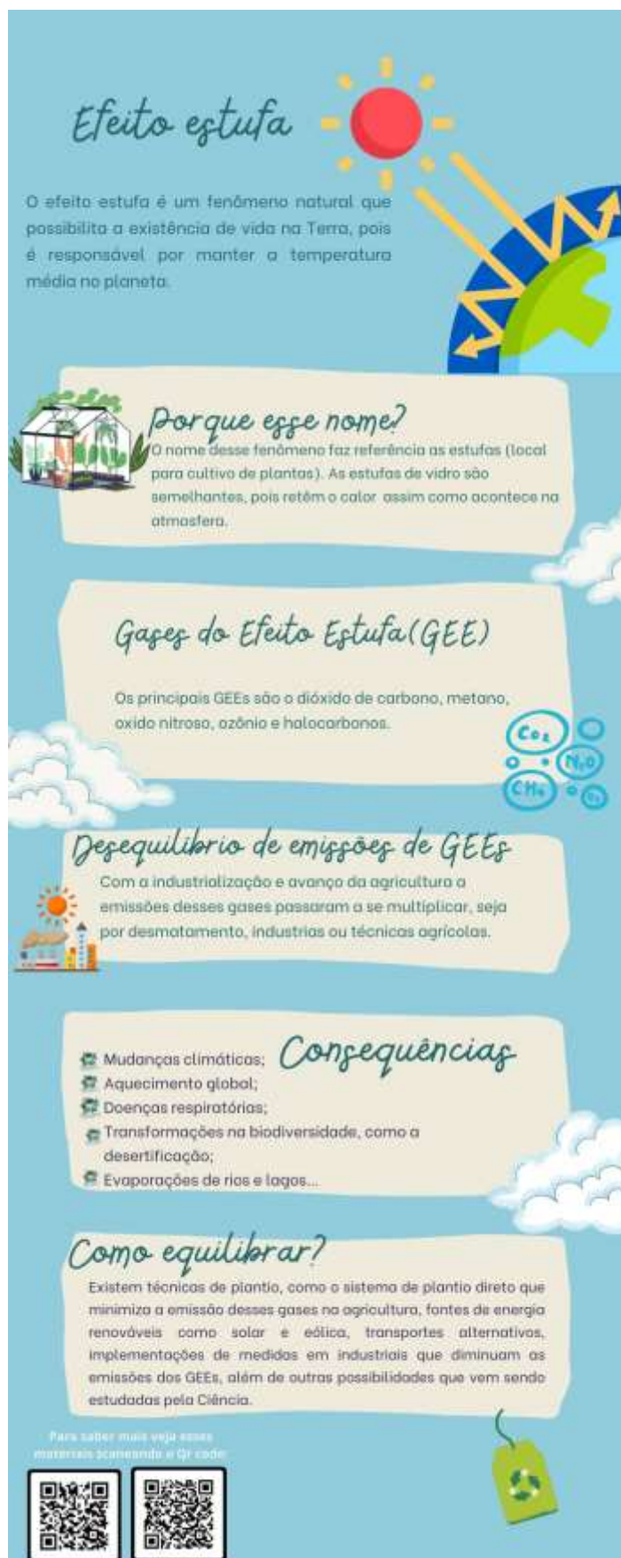
Figura 4 - Infográfico sobre o efeito estufa.