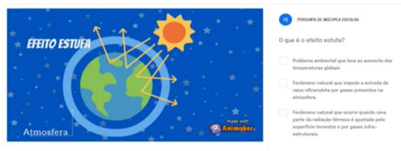
Figura 5 - Imagem do vídeo interativo sobre efeito estufa.

O vídeo foi nomeado de “gases do efeito estufa” e incluiu a gravação de áudio de fundo com as falas descritas em um roteiro elaborado previamente. Seguido pela organização das imagens utilizando a plataforma selecionada (houve uma limitação para o uso de alguns recursos nesta plataforma de forma gratuita, assim as imagens que não estavam disponíveis foram desenvolvidas no Canva com exceção da Tabela Periódica). Após o download do vídeo, exportou-se para a plataforma Edpuzzle , para a inclusão das perguntas de múltipla escolha. Conforme apresentado na Figura 5.