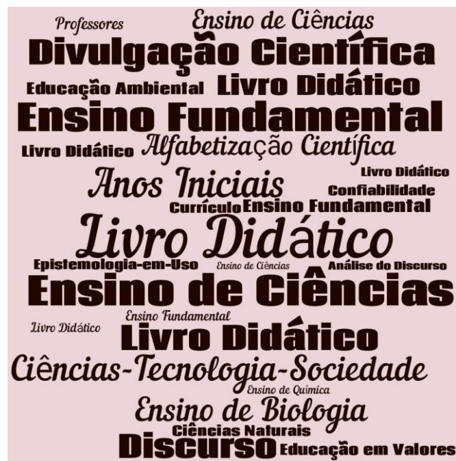
Figura 2: Nuvem de palavras composta por palavras-chave dos artigos.

indicando assim o termo/tema mais frequente dentre os trabalhos analisados. Prais e Rosa (2017) reforçam a eficiência da realização de Nuvens de Palavras como atividade de investigação atual, pelo fato também de se tratar de um método de pesquisa por meio de recursos tecnológicos (Word Cloud).