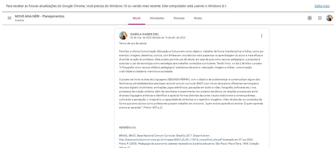
IMAGEM 1: Termo de autorização