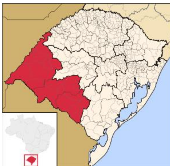
FIGURA 1: MESORREGIÃO SUDOESTE RIO-GRANDENSE (Fonte: IBGE 2010)

Uruguaiana foi fundada em 24 de fevereiro de 1843 e emancipou-se em 29 de maio de 1846. Localizada na microrregião da campanha ocidental, limita-se ao norte com o município de Itaqui, ao sul com Barra do Quaraí e República Oriental do Uruguai, ao leste com Alegrete e Quaraí e a oeste com a República da Argentina. Sua área é de 5.715,8 km 2 com população de 125.435 habitantes, localizados, em sua maioria, na zona urbana da cidade (Fonte: Instituto Brasileiro de Geografia e Estatística – IBGE, 2010). O município é o 4 o maior do Estado em extensão territorial e está a 634 km de distância de Porto Alegre, capital do Estado. O acesso a Uruguaiana é realizado pelas BR 290 e BR 472.