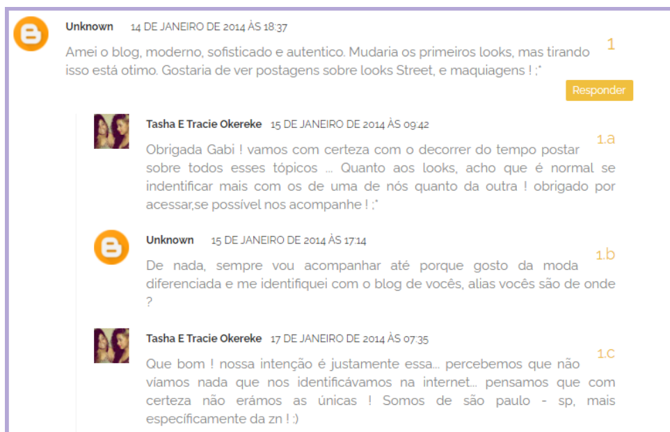
Figura 05 - Captura de tela de um comentário a partir do texto: “EXPENSIVE $HIT BABY !” (1)