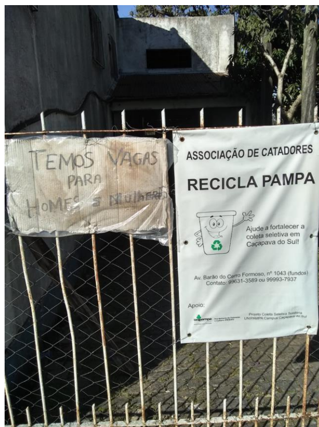
Figura 3 - Novas vagas de emprego.

As repercussões no período analisado foram satisfatórias, tendo em vista o aumento das doações de materiais recicláveis à associação e conseqüentemente aumento no número de colaboradores, considerando que em Dezembro de 2019, data da gravação do minidocumentário a Associação Recicla Pampa contava com apenas 4 colaboradores e em Julho de 2020 já estava com 9 colaboradores e ainda havia novas vagas como mostra a Figura 3. Resultado este que é atribuído a gravação e divulgação do trabalho da associação, segundo a coordenadora da Recicla Pampa.