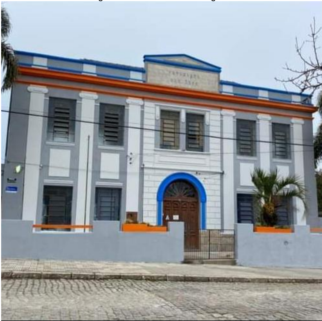
Figura 1 – E.M.E.F. Padre Pagliani

A pesquisa-ação foi desenvolvida na Escola Municipal de Ensino Fundamental Padre Pagliani, situada na praça Dr. Hermes Pintos Affonso, nº 75, no centro da Cidade de Jaguarão/RS. Trata-se de uma escola pública municipal onde os pesquisadores atuam como professores.