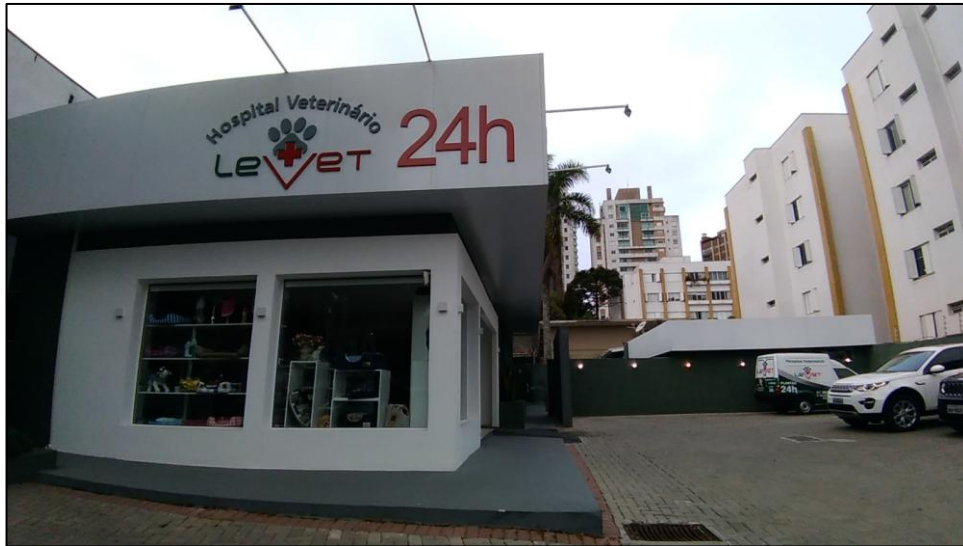
FIGURA 1- Fachada do Hospital Veterinário LeVet.

O Hospital Veterinário Levet contava com uma sala de recepção e espera (Figura 2) e a Tesouraria, para recebimento do pagamento de atendimentos e exames. Havia, ainda, um dispensário de acesso restrito, onde ficavam medicamentos para venda. Muitos tutores, por comodidade, já adquiriam ali os medicamentos prescritos durante a consulta.