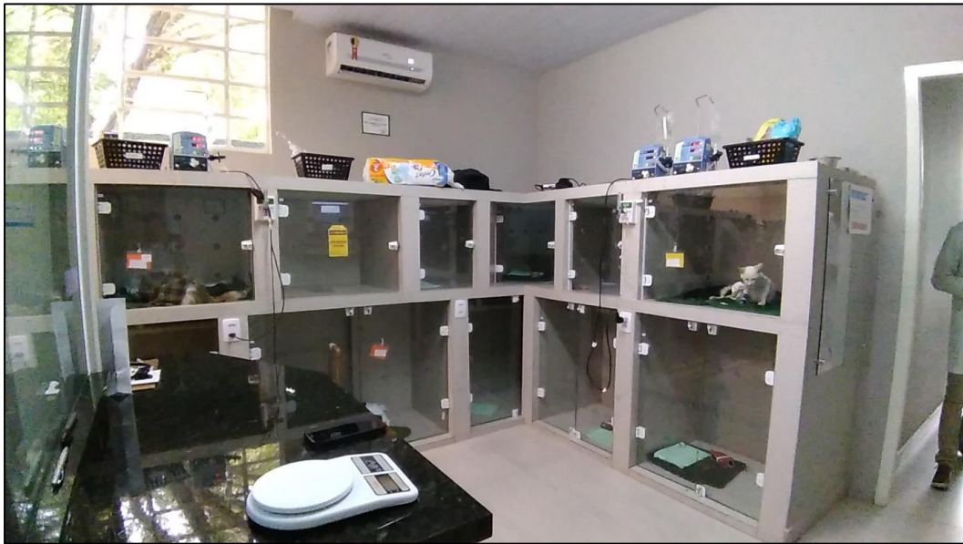
FIGURA 5 - Setor de internação.

Junto à internação, havia uma sala para recuperação anestésica, equipada com um berço de inox e colchão térmico, utilizado nos casos em que os pacientes necessitavam de maiores cuidados, um armário com medicações, acessível a estagiários e veterinários que estivessem em procedimentos no hospital, além de um frigobar onde eram armazenadas medicações com necessidade de refrigeração, bem como alimentos caseiros dos animais internados que eram trazidos pelos seus tutores, quando solicitado.