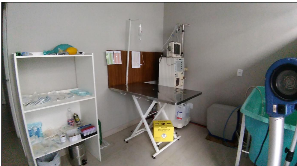
FIGURA 7- Sala de coleta e emergência.

Ainda havia uma banheira e um soprador utilizados pelos estagiários para banhar pacientes internados por longos períodos e um aparelho de hemodiálise instalado pelo serviço terceirizado de nefrologia.