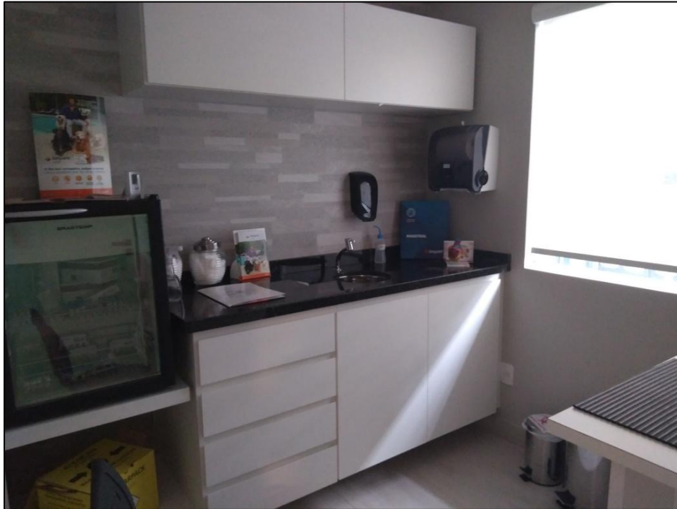
FIGURA 4- Sala de imunização.

A sala de imunização (Figura 4) era utilizada para o atendimento inicial ao cliente. O serviço de vacinação era feito nessa sala, que contava com um refrigerador para o armazenamento das vacinas.