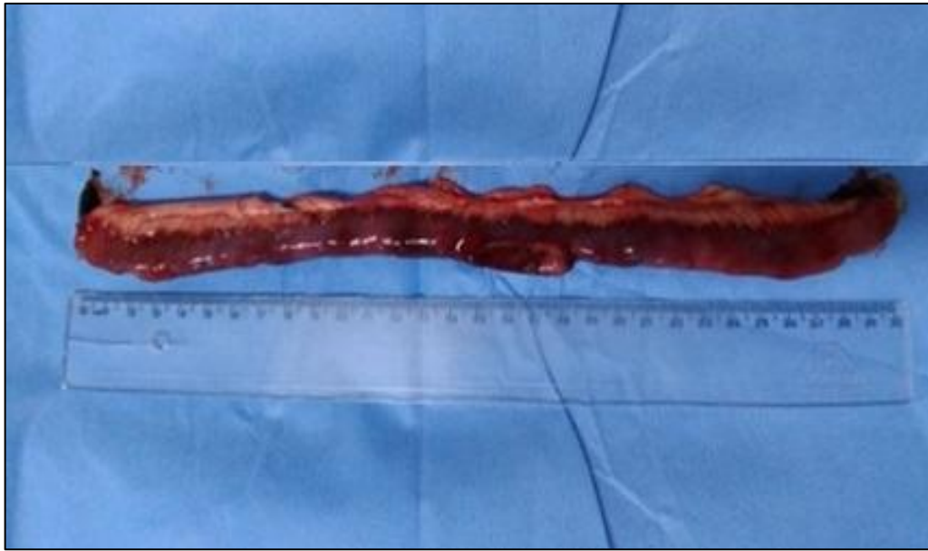
FIGURA 11- Segmento de 30cm de intestino delgado retirado em cão que ingeriu uma meia soquete.

Terminado o procedimento, o paciente foi encaminhado ao setor de internação para recuperação anestésica apresentando FC de 64 bpm, pulso normorrítmico, TPC de 2 segundos, f de 24 mpm, TR de 38,6°C e mucosas normocoradas Ellison (2005) alerta sobre a monitoração durante a recuperação anestésica, fazendo-se necessário o uso de medicação antiemética. A dieta hídrica pode ser reestabelecida a partir de oito horas pós-cirúrgicas.