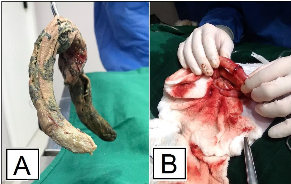
FIGURA 10- (A) Meia de nylon retirada do intestino delgado de um cão; (B) Enteroanastomose após ressecção do mesentério.

Através da incisão foi possível retirar, por meio de pressão manual suave, uma meia de nylon (Figura 10 A) que estava obstruindo o local. Na sequência, foi examinada a luz intestinal e a viabilidade do segmento por meio da estimulação e umedecimento do mesmo. Os critérios clínicos padrões para o estabelecimento da viabilidade intestinal são a coloração das paredes e mucosas intestinais, pulsações arteriais e presença de peristaltismo, sendo o último, o critério de viabilidade mais seguro.