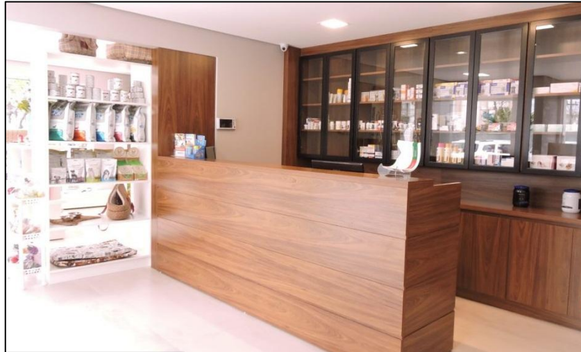
FIGURA 2- Sala de espera e recepção do Hospital LeVet.

Havia três consultórios direcionados ao atendimento clínico, equipados com materiais básicos para realização de exames clínicos como estetoscópio e termômetro, além de tubos de coleta, agulhas e seringas. Contavam também com um computador com acesso ao sistema SimplesVet ® , no qual era possível visualizar todo o histórico de consultas e resultados de exames.