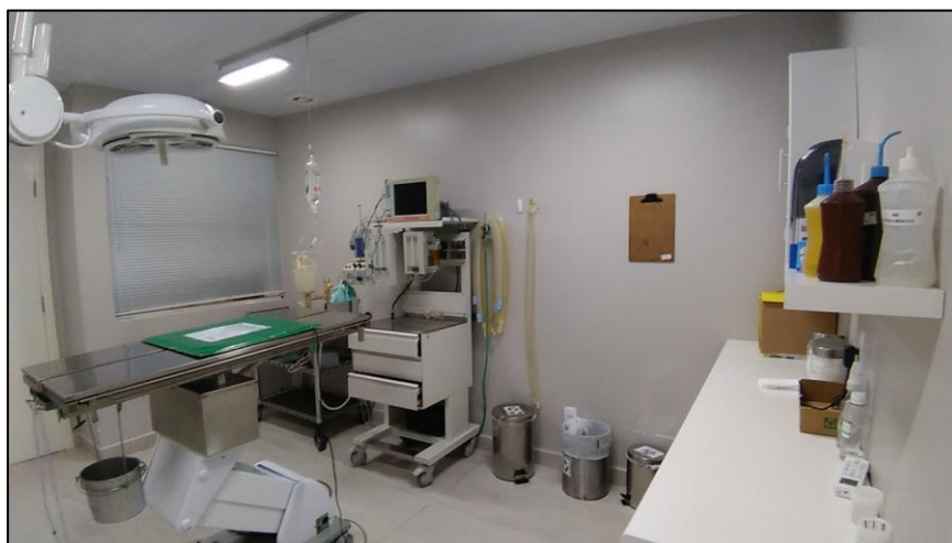
FIGURA 8- Centro cirúrgico.

Em anexo, havia uma sala de paramentação equipada com uma pia de inox com torneiras com sensores de movimento, despejando água e anti-séptico para a realização da assepsia das mãos. O Médico Veterinário responsável pela clínica cirúrgica ficava à disposição do hospital durante todo o horário comercial e atendimentos emergenciais. O serviço de anestesia era terceirizado e realizado por um médico veterinário (MV) que trabalhava como anestesista volante. Ao término dos procedimentos cirúrgicos, ficava sob responsabilidade dos estagiários lavar os instrumentos cirúrgicos, montar as caixas cirúrgicas e autoclavar gazes, compressas e demais materiais.