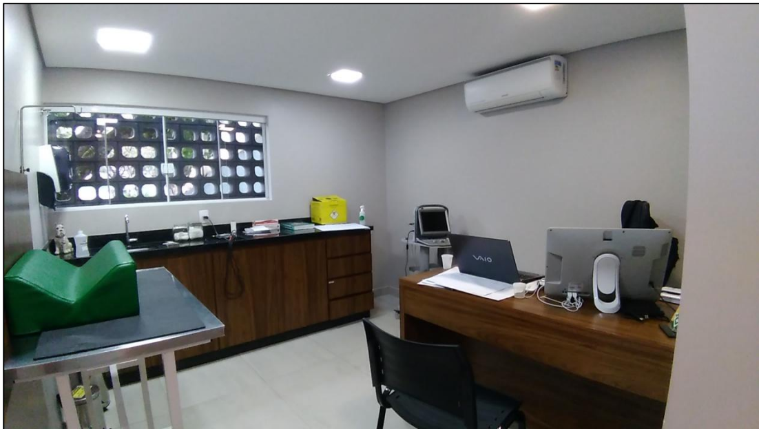
FIGURA 3- Consultório clínico com aparelho de ultrassom.

Um dos consultórios era equipado com aparelho de Ultrassonografia, (Figura 3), para realização de exames de imagem.