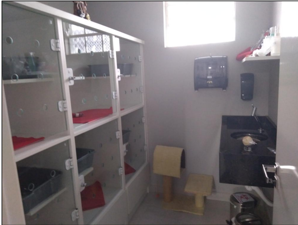
FIGURA 6- Setor de internação de felinos.

Pacientes em emergência eram levados a essa mesma sala, a qual era equipada com concentrador de oxigênio, traqueotubos de diversos tamanhos, reanimadores manuais (AMBU), laringoscópio, cateteres e uma maleta com medicamentos de emergência, como adrenalina, atropina e dopamina.