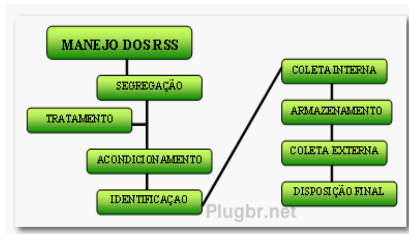
Figura 1- Manejo resíduos de Saúde

Conforme a norma Resolução da Diretoria Colegiada (2004), exemplificada nas páginas 19 a 21 RDC 306/04 da ANVISA os resíduos de saúde do Santa casa de Caridade de São Gabriel seguem o seguinte manejo: