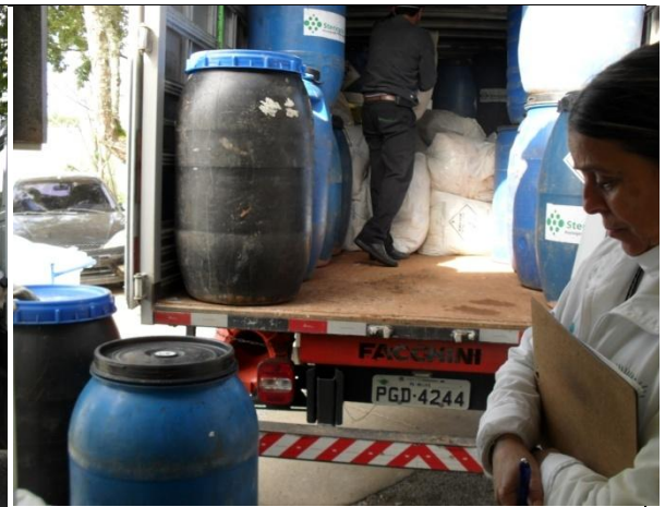
Controle material transportado