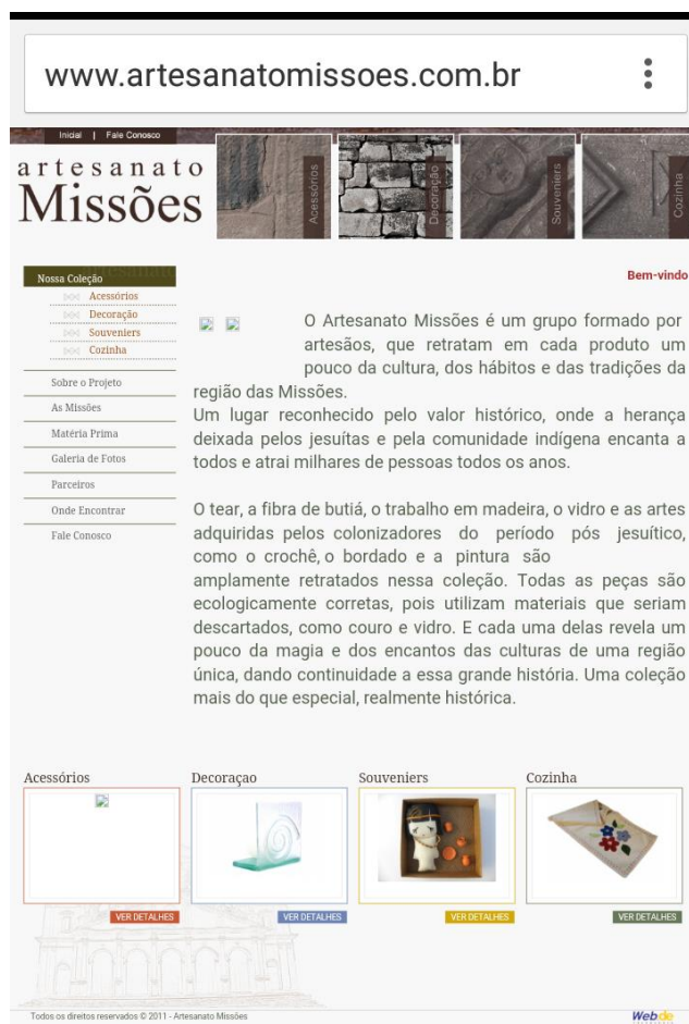
Figura 04 – Site Artesanato Missões