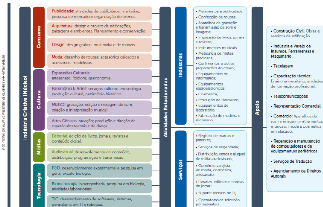
Figura 01 – Fluxograma da Cadeia da Indústria Criativa no Brasil

A cadeia da indústria criativa é formada por 3 grandes categorias: Núcleo (onde estão inseridas as atividades descritas anteriormente). Atividades Relacionadas (são profissionais e estabelecimentos que oferecem matéria-prima fundamental para o funcionamento do núcleo criativo). Apoio (ofertante de bens e serviços de forma indireta à Indústria Criativa). O fluxograma a seguir representa a Cadeia da Indústria Criativa no Brasil.