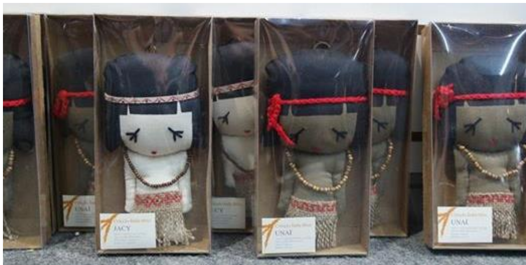
Figura 07 –Merchandising (Embalagens e rótulos Diferenciados).