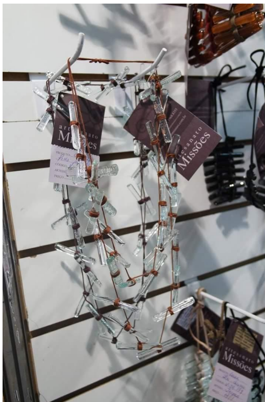
Figura 3– Artesanato Conceitual

tradição da região. Utiliza técnicas originais transmitidas de geração em geração, como é o caso da produção de tear, crochê, bordado e pintura.