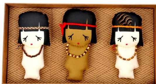
Figura 02 – Coleção Índia Miss

A artesã faz uma ressalva quanto ao processo de criação de algumas peças da coleção destacando que determinados produtos são desenvolvidos a partir de técnicas individuais. A exemplo disso, ela menciona a coleção que ela própria criou, e patenteou, denominada Coleção Índia Miss.