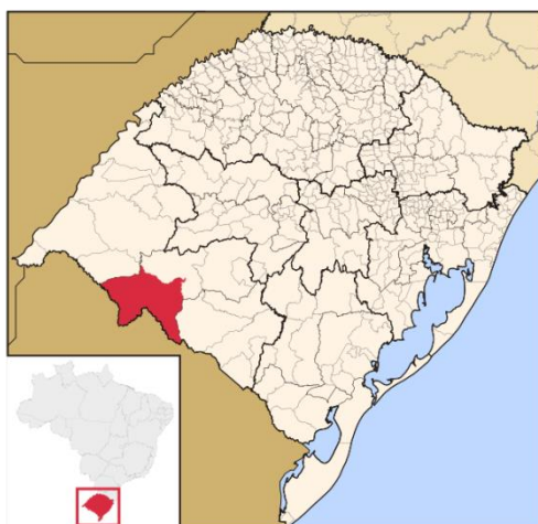
Figura 2: Localização Geográfica de Santana do Livramento