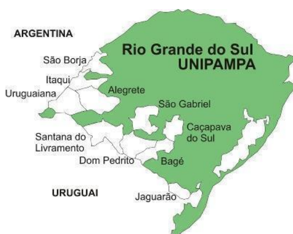
Figura 1: Distribuição dos Campi da UNIPAMPA pelo Rio Grande do Sul

Na figura 1 apresenta-se o mapa do Rio Grande do Sul com a localização dos 10 campi da UNIPAMPA.