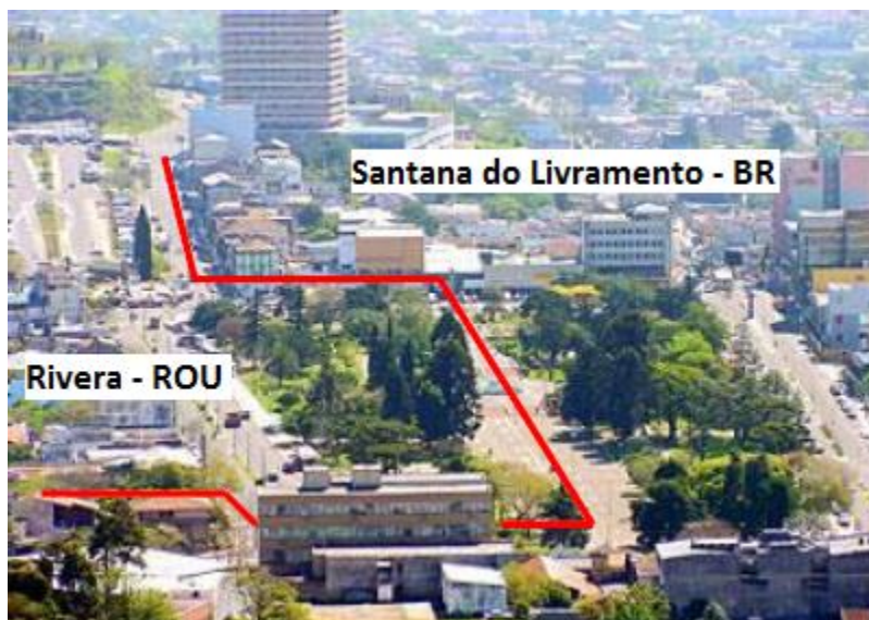
Figura 3: Foto panorâmica das cidades de Rivera e Santana do Livramento

Segundo dados do Instituto Nacional de Estadística del Uruguay – INE (2011), Rivera possui uma população de 103.447 habitantes, enquanto que Santana do Livramento, segundo dados do IBGE (2010), possui 82.464 habitantes, totalizando um grupamento populacional de 185.911 habitantes, podendo ser considerado uma das 12 maiores cidades do estado do Rio Grande do Sul e entre as 3 maiores do Uruguai. As figura 3 e 4 demonstram este agrupamento.