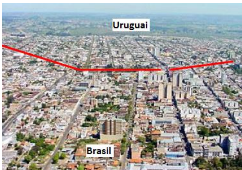
Figura 4: Foto aérea das cidades de Rivera-ROU e Santana do Livramento-BR

A UNIPAMPA, em Santana do Livramento, está sediada em um prédio próprio, situado à Rua Barão do Triunfo, n° 1048, com uma área construída de 5.497,00 m 2 , em um terreno de superfície de 5.529,17 m 2 . O prédio conta com 15 salas de aula, 01 auditório com capacidade para 320 pessoas, 02 laboratórios de informática, 19 salas de professores, 01 biblioteca e espaços para os setores administrativos e de convivência. Conta ainda, com um ginásio de esportes com área construída de 1.283,40m 2 . Atualmente o Campus Livramento está em expansão, tendo para o primeiro semestre letivo de 2014 o espaço chamado “Maristinha” reformado e com disponibilidade para alocar laboratório e salas de aula. Também está sendo construído um novo prédio anexo que irá oferecer espaço para salas de aula, biblioteca, anfiteatro e cantina.