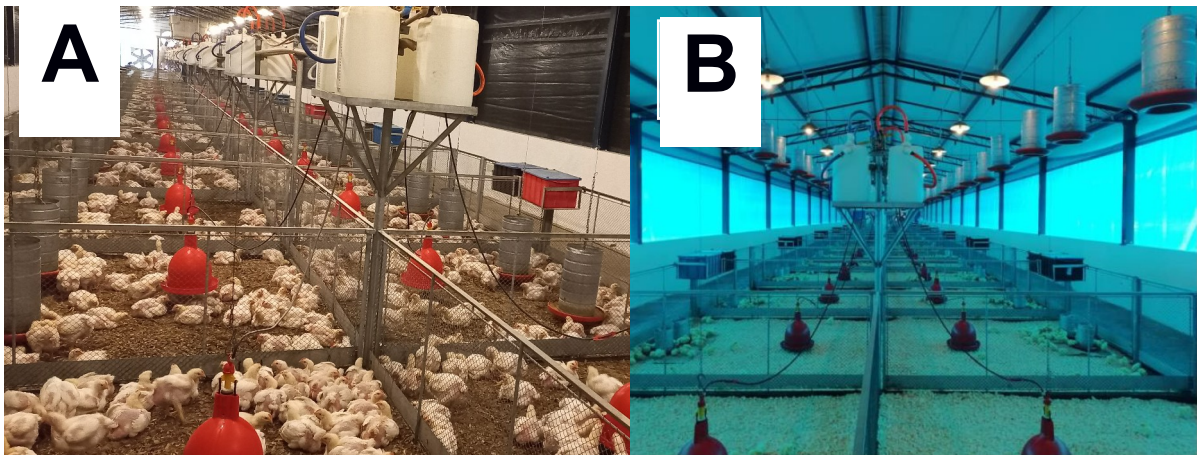
Figura 2 – Dark House (A) e Blue House (B)