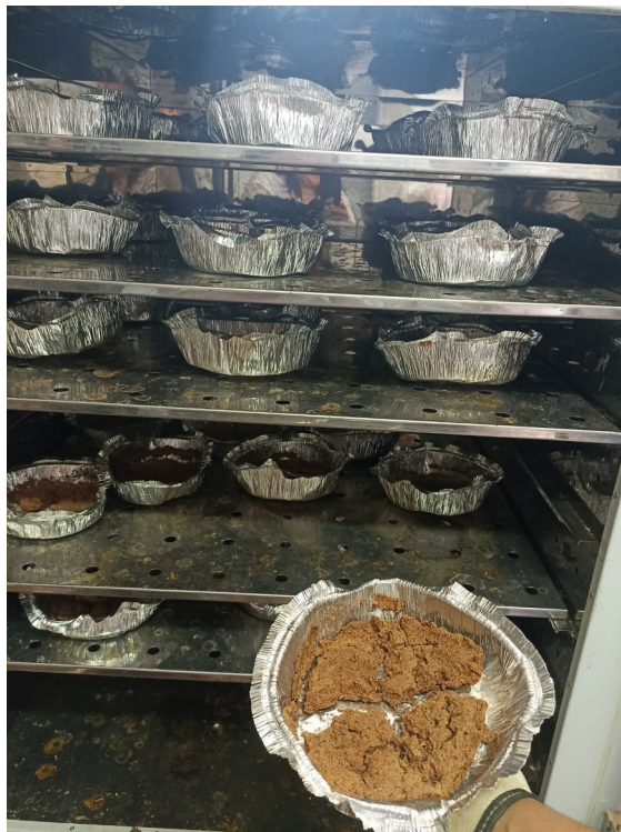
Figura 6 – Amostras de excreta do experimento de digestibilidade

Outra coleta de amostras utilizadas para análise neste experimento foi a coleta de excreta das bandejas acopladas às gaiolas, aos 18, 19 e 20 dias de vida, coletadas 2 vezes ao dia, retirando penas e retos de ração para evitar contaminação. As excretas eram acondicionadas em sacos plásticos e mantidas congeladas. Ao final do 3º dia de coleta era feita a homogeneização das amostras, e em seguida eram retiradas 400 gramas de cada box e transferidas para bandeja de alumínio (Figura 6), para então serem secadas em estufa por 72 horas à 55 °C para extrair a matéria seca. Após estarem secas, as amostras eram embaladas e identificadas para enviar à outra unidade da empresa responsável pelas análises finais. Outra coleta de amostras para a análise de digestibilidade foi feita ao final do lote, onde realizou-se necropsia de dois animais por box para retirada de amostras do jejuno e íleo para análise utilizando o método ISI. As amostras foram acondicionadas em potes de coleta universal com formalina e enviados para a análise histológica na unidade da empresa em Rio Claro-SP.