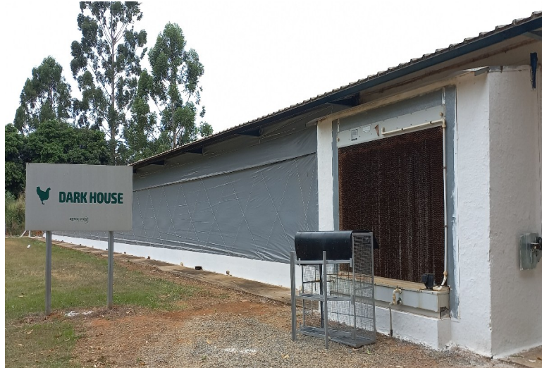
Figura 3 – Túnel de Resfriamento Adiabático Pad Cooling

por pressão negativa em até 6 °C, fornecendo uma melhora nos níveis de oxigênio, e conseqüentemente remove partículas de amônia e gás carbônico dentro do aviário.