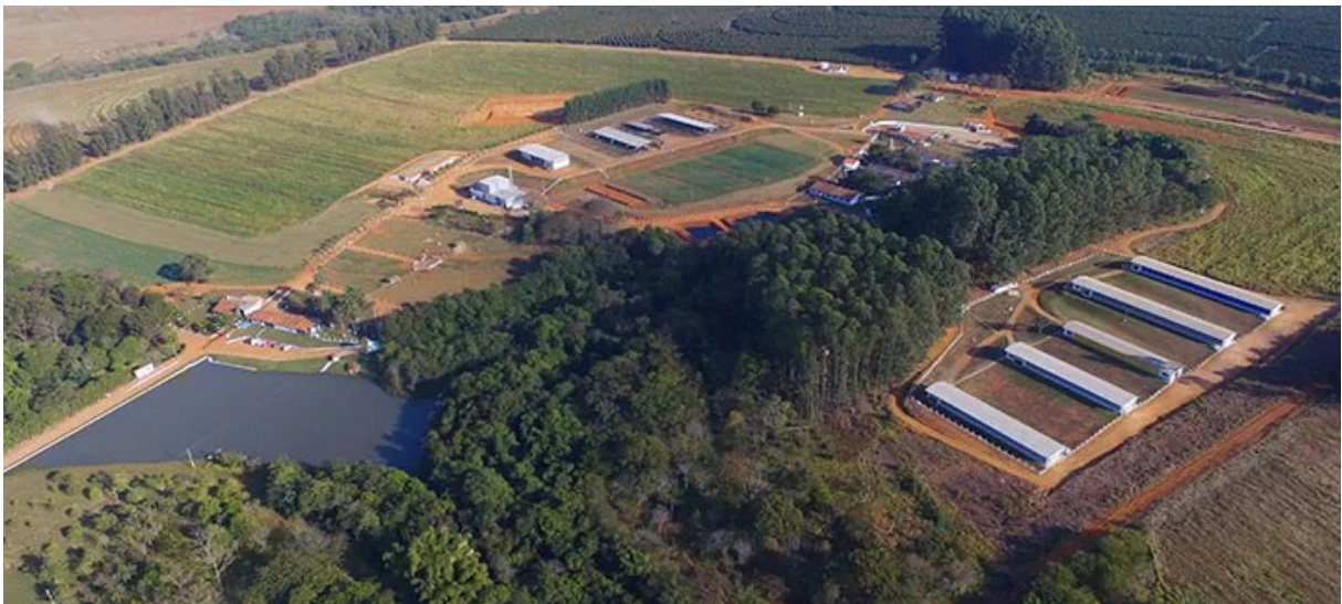
Figura 1 – Vista aérea do Centro de Pesquisa Prof. José Maria Lamas da Silva