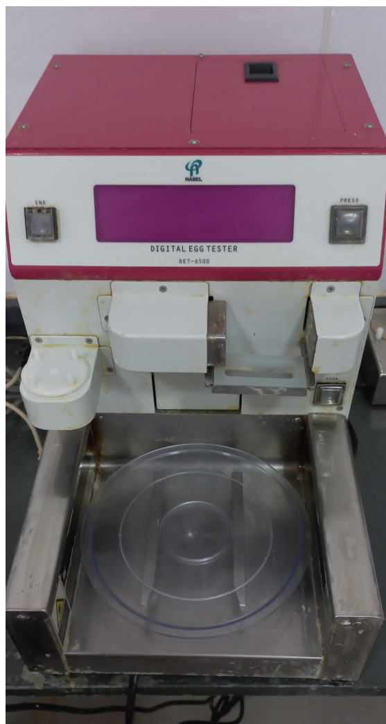
Figura 8 – Máquina Digital Egg Tester®

Durante o estágio foi possível acompanhar o processo de análise da qualidade dos ovos produzidos pelo setor de postura da empresa. A sala da qualidade de ovo possui uma bancada com máquinas para os testes, sendo elas a Digital Egg Tester® (Figura 8) ao qual mensura o peso do ovo, resistência da casca e altura do albúmem, com essas informações conseguimos calcular a unidade Haugh (UH), ainda a espessura da casca é feita na região equatorial do ovo onde era aferida por um micrômetro eletrônico da marca Mitutoyo®.