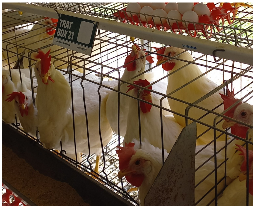
Figura 9 – Bebedouro automático Nipple

Neste setor eram utilizadas aves da linhagem Hisex, no qual o lote deveria produzir no tempo de 83 a no máximo 93 semanas. Estas foram acomodadas no barracão que possuía 224 gaiolas metálicas com capacidade de 12 galinhas por box, com uma divisão no meio separando 6 aves para cada lado, com comedouros do tipo linear e bebedouros automáticos do tipo nipple (Figura 8).