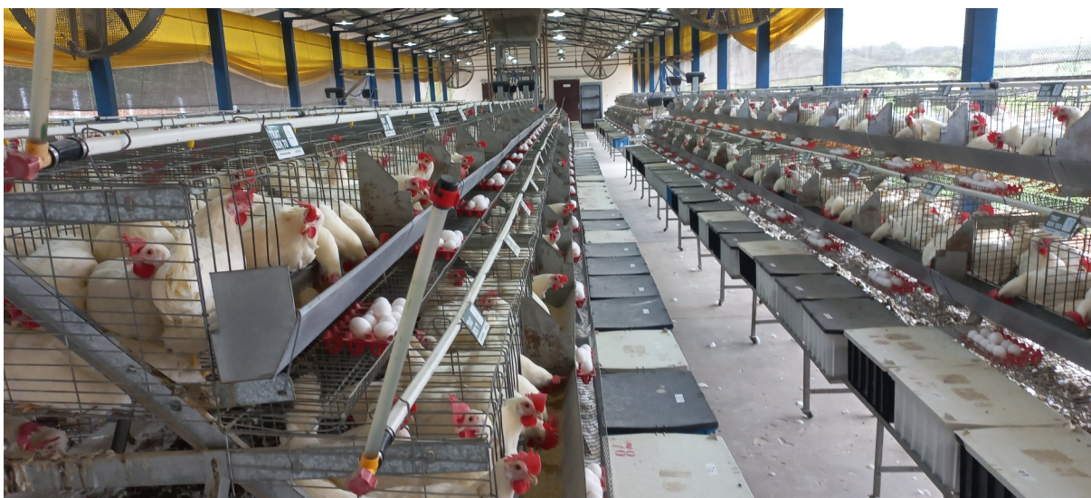
Figura 10 – Barracão do setor de poedeiras

Estão posicionadas cortinas amarelas nas laterais no galpão, que eram acionadas no início da tarde para diminuir a incidência de raios solares nesse período e levantadas no final da tarde (Figura 9). O programa de luz utilizado para as aves de 17 a 90 semanas era de 8 horas de escuro e 16 horas de luz natural (8E:16L), apagando as luzes às 21 horas e ascendendo novamente às 5 horas, com incidência de 50 a 60 lux. Já a temperatura, umidade e velocidade do vento era monitorado por meio de um datalogger e era feito o monitoramento do mesmo no painel anexo a extremidade do barracão, onde, segundo a curva de conforto térmico, a temperatura para 17 à 90 semanas deve ser de 20°C e a umidade relativa de 65 à 70%. A água oferecida aos animais era clorada e os reservatórios de água são reabastecidos diariamente, é preciso mensurar o nível de cloro na água pelo menos duas vezes na semana. Os parâmetros da água esperados para cloro e pH deveriam estar entre 3 a 5 ppm e 6 e 8, respectivamente mensurados por meio de um kit manual de aferição de cloro e pH.