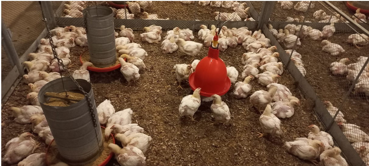
Figura 4 – Bebedouros e Comedouros do Setor de Frango de Corte

Os comedouros utilizados do dia 1 ao dia 7 é o infantil, após esse período o comedouro é substituído pelos de tamanho adulto, os mesmos junto dos bebedouros devem ser limpos pelo menos 1 vez na semana, os comedouros e bebedouros utilizados (Figura 4). São feitas a rotação dos comedouros para estimular a ingestão de ração, esse procedimento é realizado no mínimo quatro vezes ao dia até o final do lote.