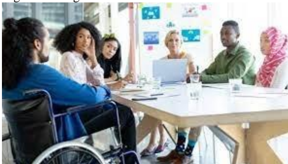
Figura 3: Imagem da diversidade 3

Na foto 3 os entrevistados foram indagados com a mesma pergunta. Você contrataria uma dessas pessoas para uma vaga de vendedor na sua empresa? Qual delas? Ou quais delas? E qual delas você não contrataria? Por quê?