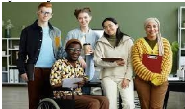
Figura 2: Imagem da diversidade 2

Na fotografia 2 foi feita a mesma pergunta. Você contrataria uma dessas pessoas para uma vaga de vendedor na sua empresa? Qual delas? Ou quais delas? E qual delas você não contrataria? Por quê?