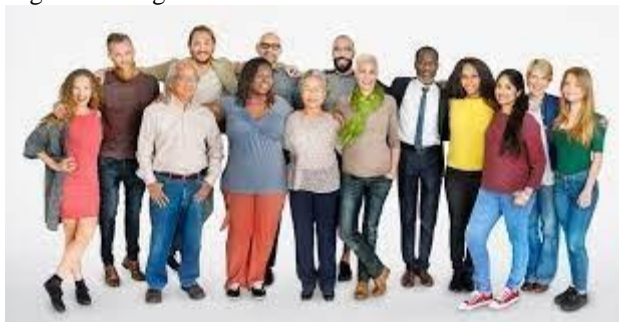
Figura 1: Imagem da diversidade 1