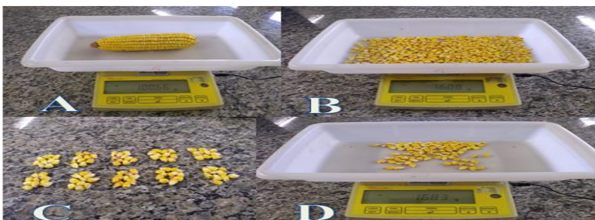
Figura 1. Descrição das avaliações das variáveis: peso da espiga (a), peso do grão (b), peso de mil grãos (c), e número de grãos por espiga (d) no final da página anterior.

Para o segundo ano a adubação de base utilizada foi à mesma aplicando-se 350 \text{ kg ha}^{-1} da formulação 5-20-20, conforme a recomendação para a cultura do milho. Na área não foi realizado calagem. A adubação nitrogenada utilizou a ureia com 45% de concentração como fonte de N, consistiu de duas formas, onde no tratamento com N, foram aplicados 54 \text{ kg ha}^{-1} de N no estágio V_3 - V_4 e a segunda em V_6 / V_8 , enquanto que no tratamento sem N, não foi aplicado N em cobertura. Sendo realizada a capina para o controle de plantas invasoras e utilizado inseticida (Arrivo ® ) para o controle de insetos. Sendo realizada a colheita da cultura manualmente e posterior secagem das espigas em estufa de circulação de ar, retirando-se a umidade das mesmas, após as espigas foram trilhadas e pesadas as suas variáveis estão descritas na sequência abaixo. Avaliando as seguintes variáveis (Figura 1): i) Peso de espiga (PE), em gramas, realizando a pesagem das espigas inteiras; ii) Peso de grãos (PG), em gramas, sendo feita somente a pesagem dos grãos; iii) Peso de mil grãos (PMG), realizado a contagem de 100 grãos e a pesagem dos grãos; iv) Número de grãos da espiga (NGE), sendo realizada a contagem dos grãos; e v) Rendimento de grãos (RG), onde foi realizada a conversão do peso de grãos pelo número plantas, em \text{kg ha}^{-1} .