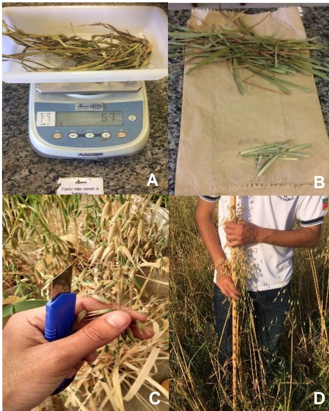
Figura 1. Peso de matéria seca (a), relação folha:colmo, parte superior folha, inferior colmo (b), panícula de aveia madura (c), medição de estatura de plantas (d).

Para estimação de ganhos genéticos foi utilizado o índice clássico de Smith e Hazel, utilizando cinco pesos econômicos: DPg, CVg, Média 1:1 e aleatório (30,30,500,1500). Os dados em relação a DPg, CVg e Médias, foram obtidos através da Análise de Variância (ANOVA). Porém, o peso 1:1 foi atribuído para manter uma uniformidade entre as variáveis, atribuindo o mesmo valor para