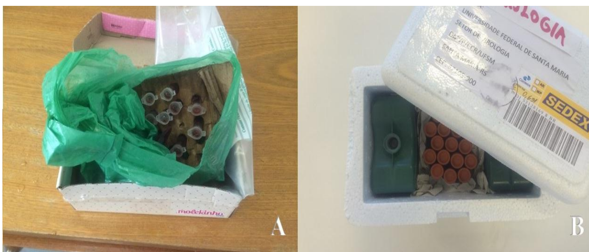
Figura 2: Amostras recebidas para diagnóstico virológico. A) Amostras inadequadamente armazenadas e transportadas, demonstrando estado avançado de hemólise, em caixa de papelão sem refrigeração. B) Amostras corretamente armazenadas e transportadas em caixa isotérmica, com gelo reciclável envoltas em jornal.

Durante o ECSMV foi comum o recebimento de amostras com pouco volume, hemolisadas, soltas dentro de caixas isotérmicas, sem qualquer tipo de resfriamento ou até mesmo suspensas em gelo derretido. Outro problema grave foi a falta de identificação das amostras e/ou do requerimento de exames.