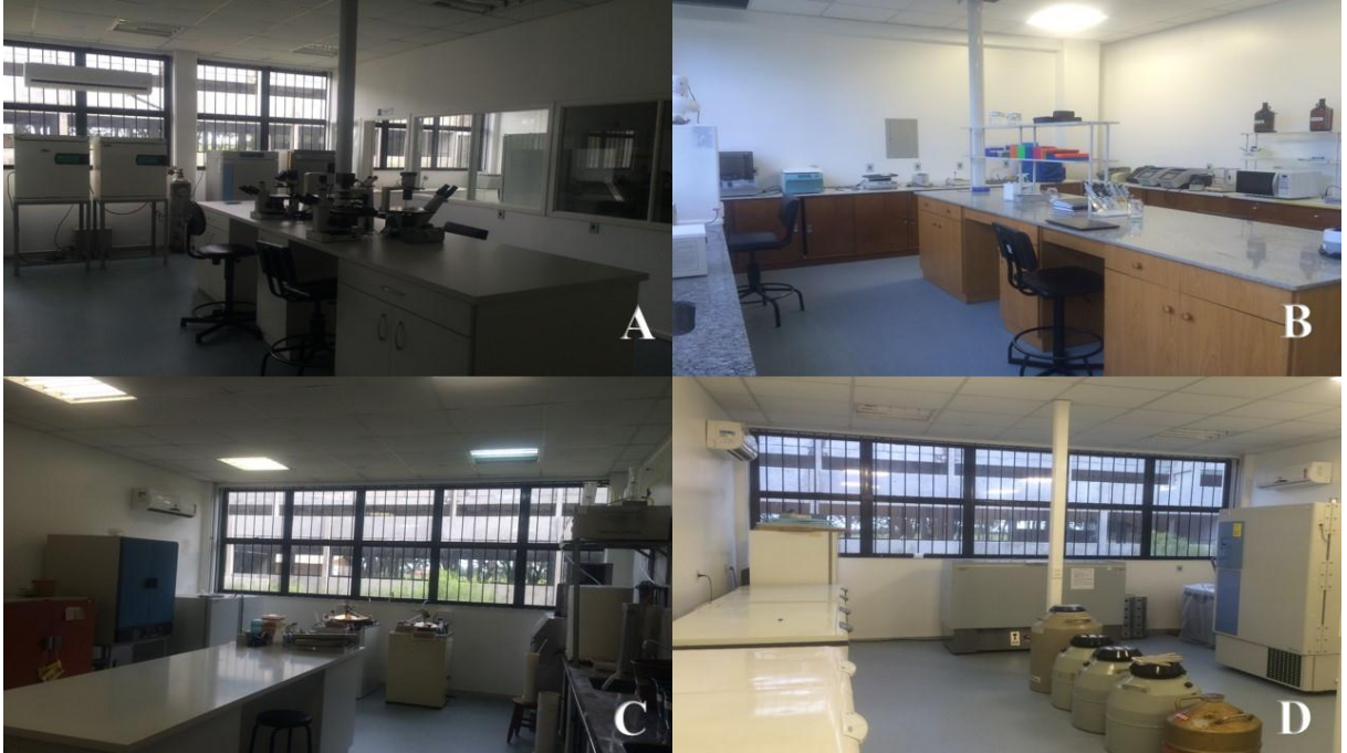
Figura 1: A) Sala de cultivo de vírus e células. B) Sala de biologia molecular. C) Sala de lavagem e esterilização de materiais. D) Sala de equipamentos.