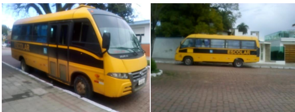
Figura 2: Micro-ônibus utilizados no transporte da Escola Sucessão dos Moraes

No que tange a realidade da Escola Sucessão dos Moraes, Dorval, responsável pela coordenação dos motoristas, destacou que o tempo das rotas poderia ser diminuído se as estradas estivessem em melhores condições. Pois, existem trechos inacessíveis, fazendo com que o motorista utilize rotas alternativas, com distâncias maiores e velocidade muito abaixo da permitida. Tais escolhas servem para evitar o sucateamento da frota, que conforme Figuras 2 e 3 estão em bom estado de conservação.