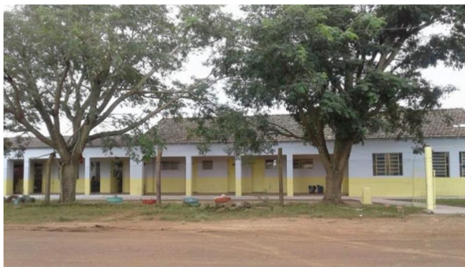
Figura 1: Fachada da Escola Municipal Rural Sucessão dos Moraes