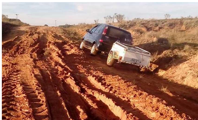
Figura 5: Estrada do Ponche Verde, trecho utilizado para chegar à escola (2017)