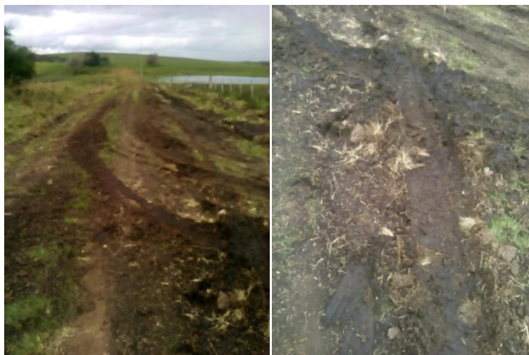
Figura 4: Estrada do Ponche Verde, trecho utilizado para chegar à escola (2018)