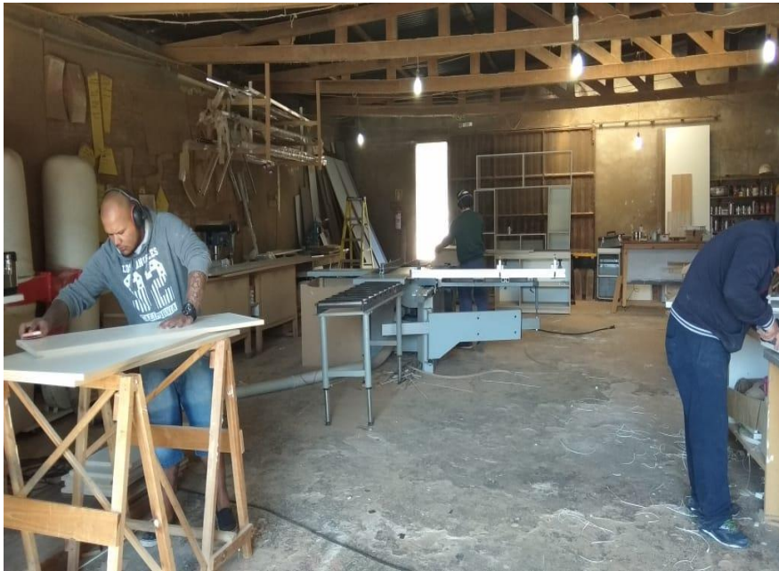
Figura 3- Unidades produtivas fábrica ABC