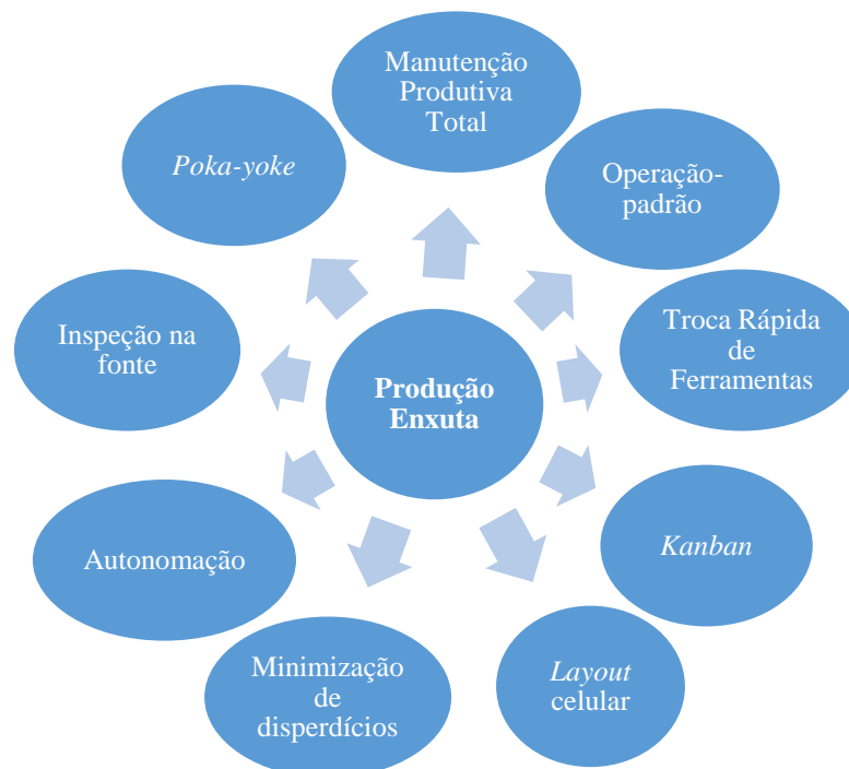
Figura 1 – Principais subsistemas da produção enxuta

A operação padrão promove o balanceamento das operações, ajustando a taxa de produção, a qualidade e os procedimentos de trabalho conforme a demanda. A Troca Rápida de Ferramentas baseia-se no emprego de sistemas automatizados para reduzir os tempos de preparação das máquinas, viabilizando a produção em pequenos lotes. O layout celular é uma mescla do layout por processo (apresenta maior flexibilidade de produção) e do layout por produto (emprega a padronização dos produtos e maior utilização da capacidade produtiva), agrupando a família de peças de fabricação em células, as quais são interligadas por uma linha de montagem (ANTUNES et al., 2008). A Figura 1 aborda os principais subsistemas da produção enxuta.