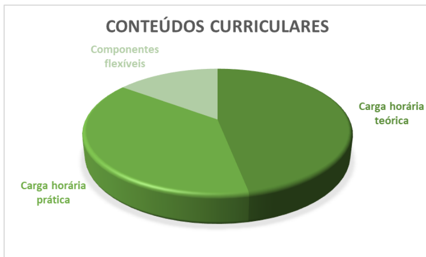
Gráfico 1: Distribuição dos componentes curriculares do Curso de Fisioterapia da UNIPAMPA

Em relação aos componentes curriculares obrigatórios a carga horária teórica é de 1.860 (mil oitocentos e sessenta) horas-aula, representando 124 (cento e vinte e cinco) créditos acadêmicos, e a carga horária prática é de 1.530 (mil quinhentos e trinta) (102 créditos acadêmicos). Já os componentes flexíveis que são as atividades complementares do curso contemplam 610 (seiscentas e dez) horas-aula.