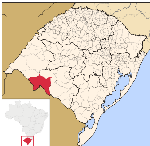
Figura 2: Localização Geográfica de Santana do Livramento

divisa seca (uma rua urbana) a cidade de Rivera, capital do Departamento de Rivera, da República Oriental do Uruguai.