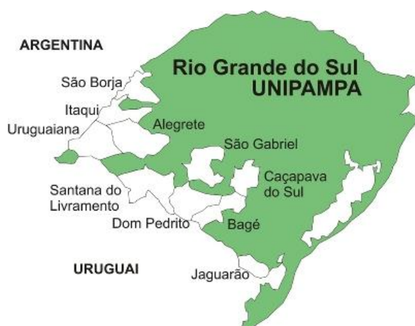
Figura 1: Distribuição dos Campi da UNIPAMPA pelo Rio Grande do Sul

Na figura 1 apresenta-se o mapa do Rio Grande do Sul com a localização dos 10 campi da UNIPAMPA.